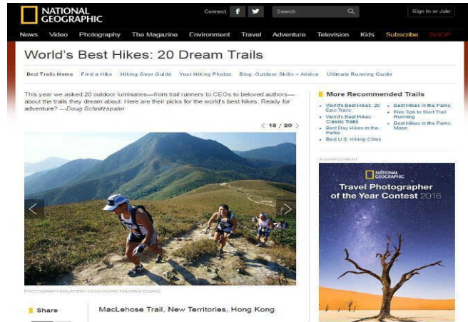
▲ 國家地理頻道挑選全球20條最佳夢想山徑