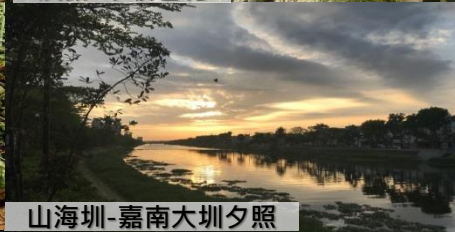
山海圳-嘉南大圳夕照