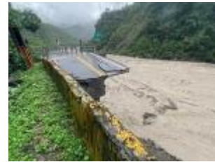
15k+900 路基流失30m 預計8/2搶通