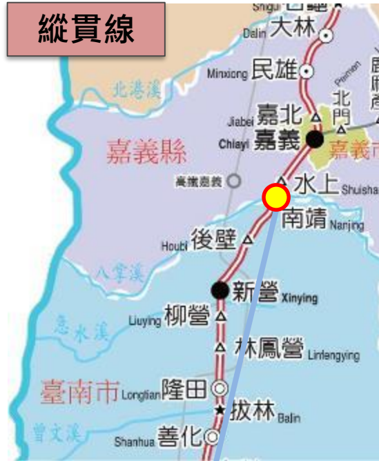
K306+950 八掌溪橋南橋台路基掏空