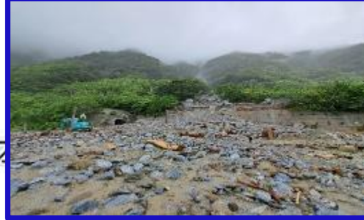
K53+800 西正線小清水溪橋沖毀