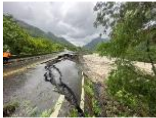
21k+200 路基流失200m 預計8/10搶通