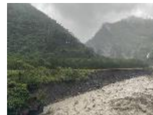
15k+150 路基流失250m 8/1搶通