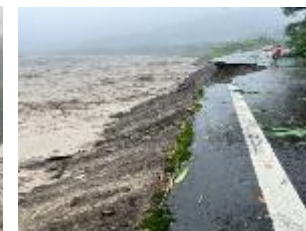
11k+150 路基流失200m 7/30搶通