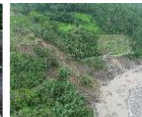
4k+500 路基流失500m 預計8/7搶通

搶通策略：那瑪夏居民暫由嘉129-1線，銜接嘉129線，再接台3線大埔後進行脫困！（無孤島效應） 搶修機具已進入災區，由那瑪夏端（北）及甲仙端（南）兩端分進辦理搶通作業中，搶救節奏如下：