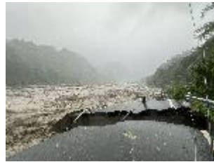
17k+500 路基流失500m 預計8/4搶通