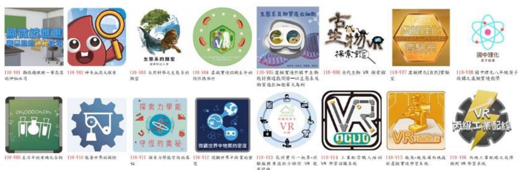
圖 1：教育部 VR 教學應用教材

持續以十二年國民基本教育課程綱要為範圍，開發可融入課程教學使用的 VR 教材，提升中小學教師之新科技認知，學生透過 VR 教材之沉浸式互動，進行探索與模擬體驗，以幫助提升學生理解與學習效果。110 年共補助 16 件 VR 教材計 107 單元，包含自然科學領域之生物科目 6 件、理化科目 6 件及高職專業證照課程 4 件，教材透過專家學者審查後放置於教育雲(教育大市集)，以創用 CC 方式提供全國教師免費下載使用，每件教材備有教材軟體操作說明、教案及學習單，以利教師運用 VR 教材於教學現場。