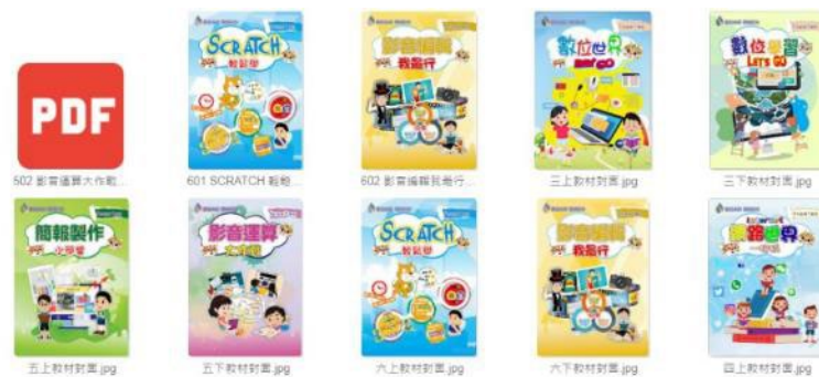
圖 4：國小資訊教育教材

依據國家教育研究院 109 年 6 月發布之「國民小學科技教育及資訊教育課程發展參考說明」，發展資訊教育參考教材，以利國中小課程銜接。教材內容著重運算思維、虛擬實境(VR/AR)、人工智慧、物聯網、數位自造等生活應用內涵，可供體驗學習、自主學習、線上學習、專題導向學習(PBL)等使用，培養數位公民素養。預計編製國小 3-6 年級 8 冊資訊教育參考教材(包括數位內容及影片)，110 年完成 3 年級數位教材影片共 52 部，並上傳教育部教育雲。