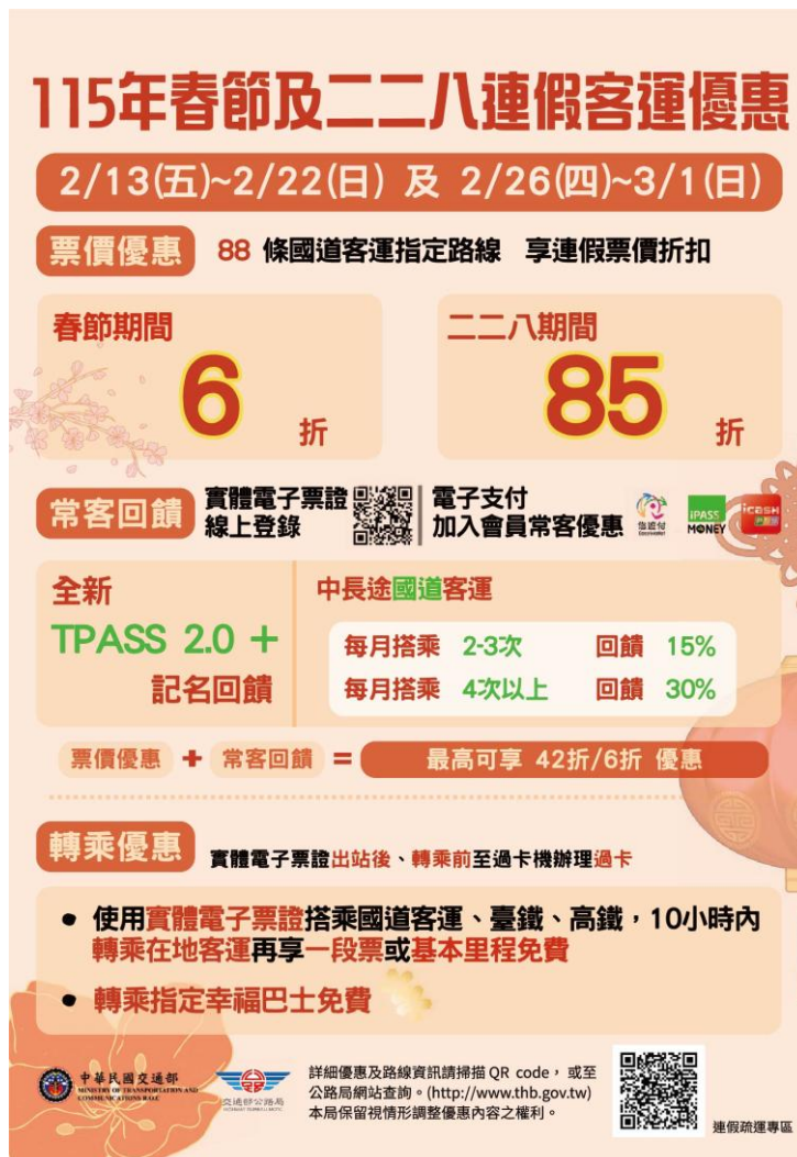
圖 5、國道客運優惠措施