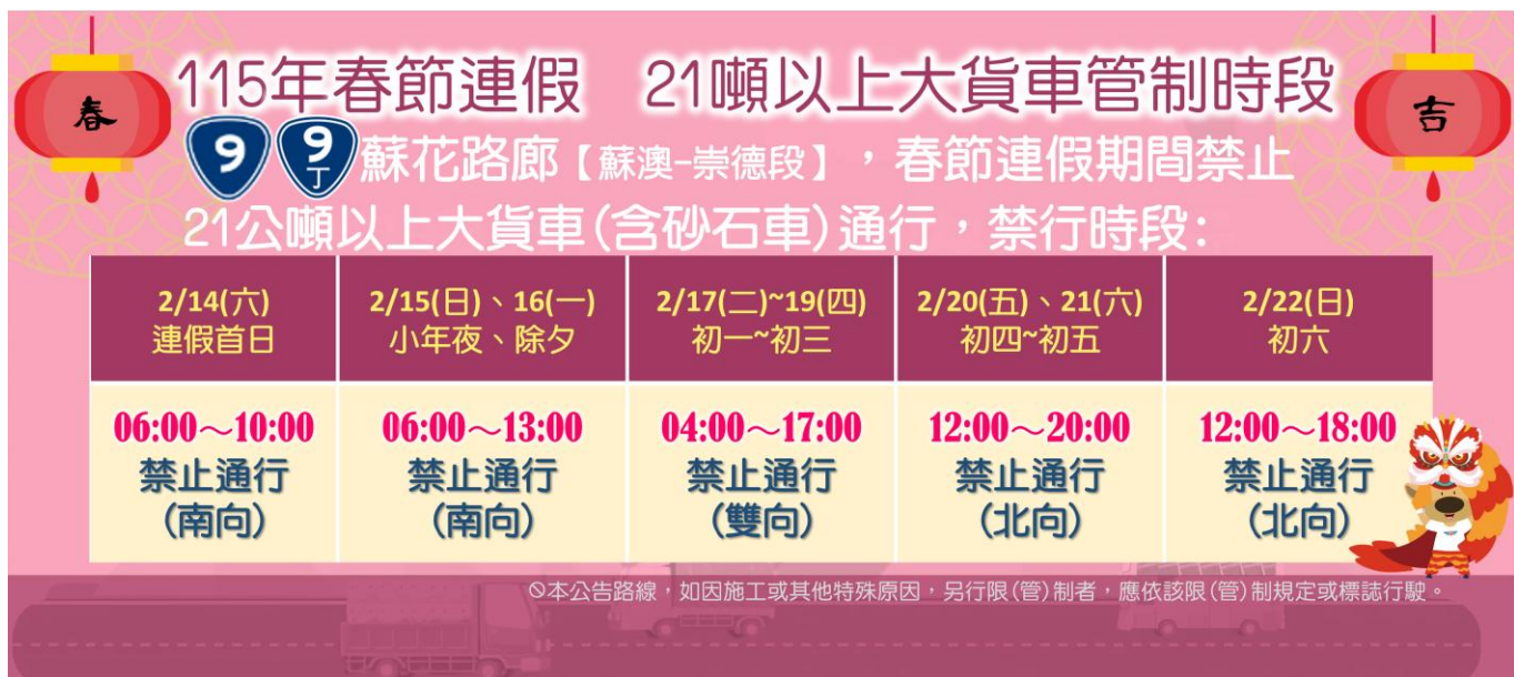
圖 3、蘇花路廊管制措施