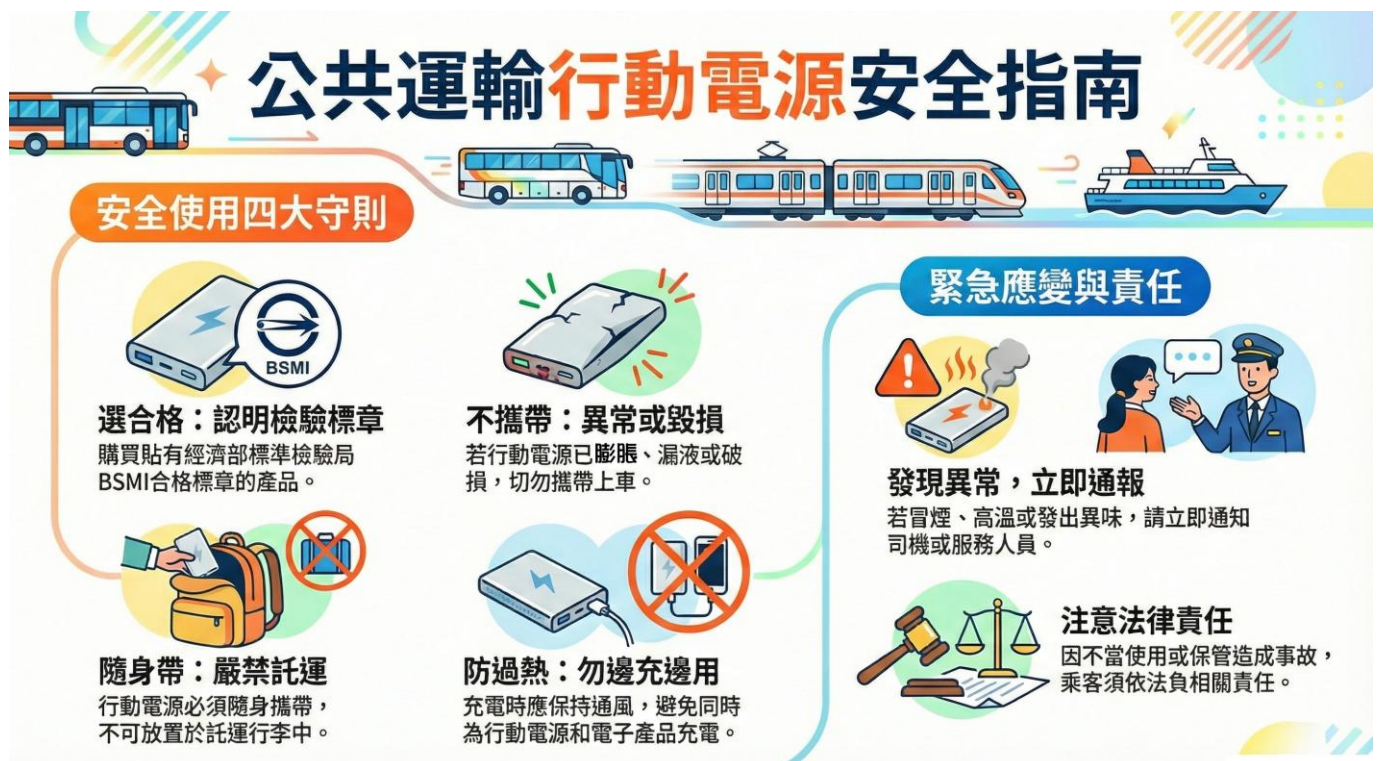
圖 6、公共運輸行動電源安全指南