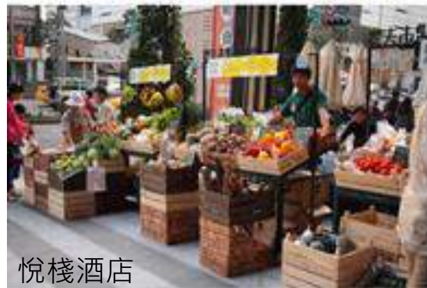
悅棧酒店 農夫市集