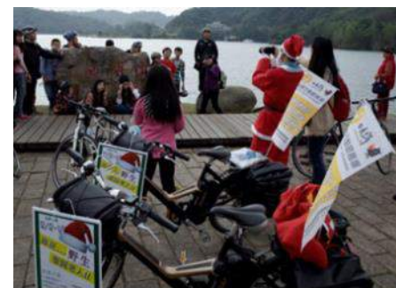
試辦走動式旅遊服務18