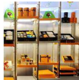
冠閣商旅 在地伴手禮賣店