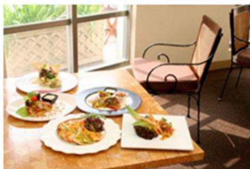
劍湖山飯店 在地食材特色料理