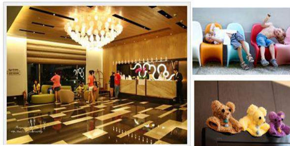
飛燕城堡渡假飯店-原住民文創商品賣店規劃