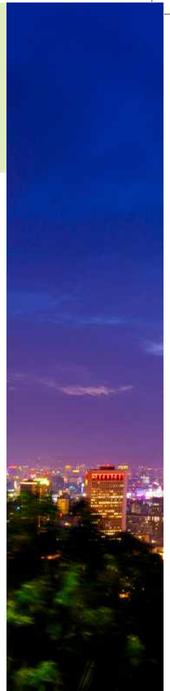
我國與新南向政策夥伴國家107年互訪目標500萬人次