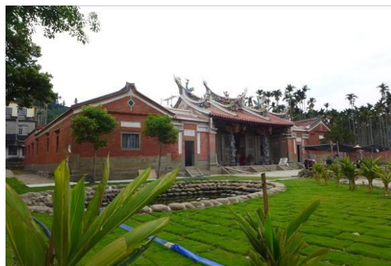
姜氏家廟修復後全貌