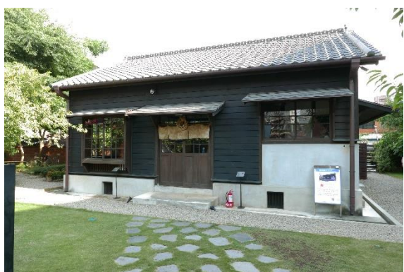
關西分駐所所長宿舍