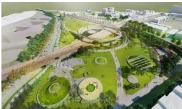
1895 乙未戰役紀念公園

「永安海螺文化體驗園區」及「竹北六張犁東興圳」等17處藝術村、大地園藝及自然景觀優化工作，優化浪漫臺三線自然地景，並完成重要遊憩據點建設。