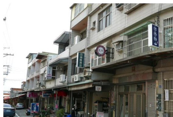
關西石店子老街小招牌改造