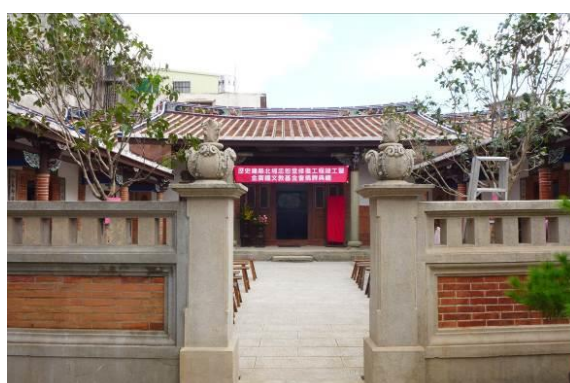
北埔忠恕堂修復後全貌