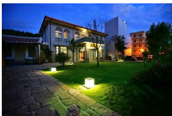
姜阿新洋樓