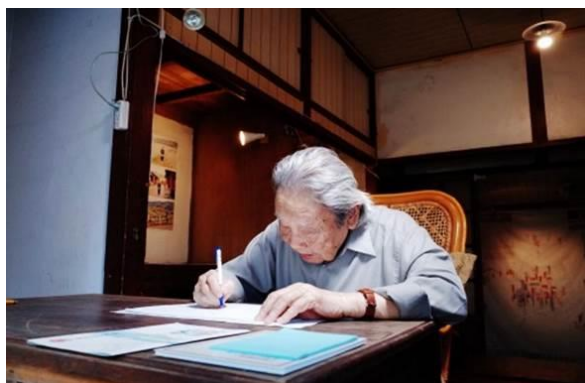
復原龍潭國小宿舍復原鍾肇政老師昔日寫作場景

透過客家浪漫臺三線計畫及客家文化生活環境營造計畫資源，完成鍾肇政、張芳杰、姜阿新及詹冰等客家大師故居修復再利用，建置鄧雨賢及龍瑛宗紀念館，並修復汀州客二次移民重要史蹟「苗栗市田心謝氏陳留堂」，為浪漫臺三線打造新文化亮點。