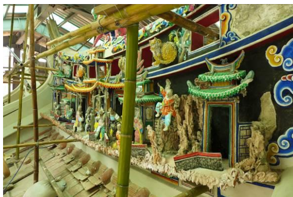
北埔姜氏家廟剪黏修復

「六堆客家文化信仰中心整體風貌改善計畫」、「花蓮市好客文化會館工程」及「臺東客家學堂修繕計畫」等文化資產維護及聚落保存案計56件，藉由古蹟的修繕與閒置空間再利用，認識文化資產的新價值，充實在地之文化設施，創造新的資產活力，並結合地方團體力量發展地方特色，利用現有豐富的環境發展在地地方特色，塑造獨特的人文風情。