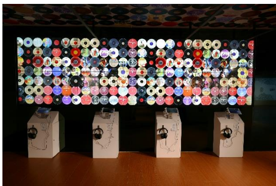
鄧雨賢臺灣音樂紀念館