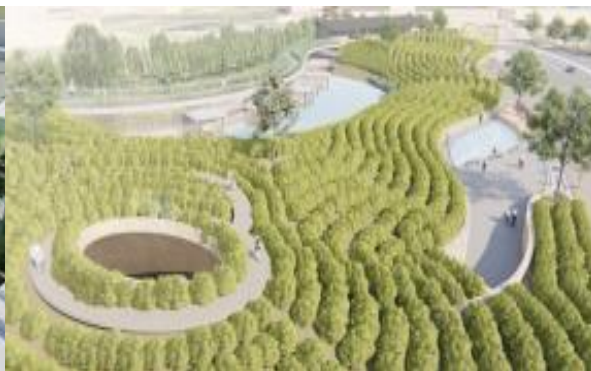
臺灣客家茶文化館