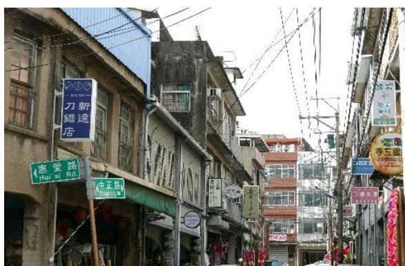
關西石店子老街小招牌改造

推動「龍潭十一份」、「關西老街」、「大湖老街」、「東勢老街」、「東勢大茅埔」及「豐原翁仔社」等客庄傳統街區環境改造工作，重現客庄傳統街區歷史紋理及營造質樸整潔之環境氛圍。