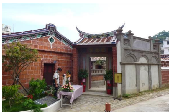
北埔忠恕堂照壁為一大特色