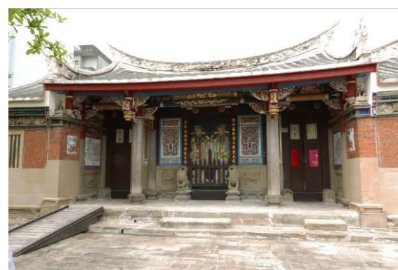
新埔宗祠博物館聯營計畫核心館舍-陳氏宗祠