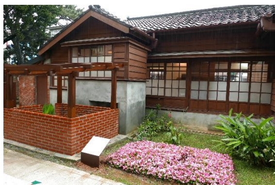
鍾肇政老師任職龍潭國小之居所