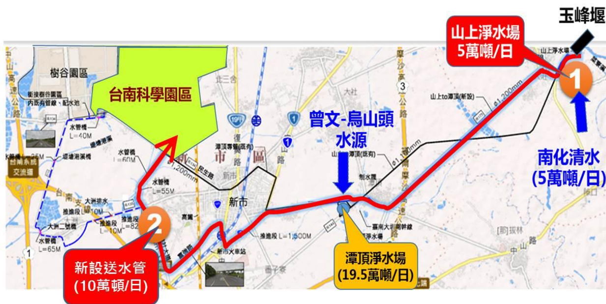
圖 1-1 本計畫工程位置平面圖