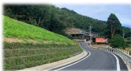
嘉義縣梅山鄉龍眼林農路改善