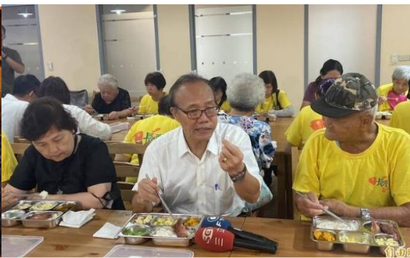
農業部次長在與長者一起享用暖心餐盒