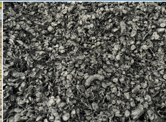
東石合作農場非生物性(農膜)剩餘資源循環場域，每年可清洗2千公噸農業廢塑膠