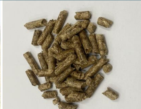
農糧產業剩餘資源循環場域每年至少可再利用5千公噸果樹竹枝及4百公噸鳳梨葉