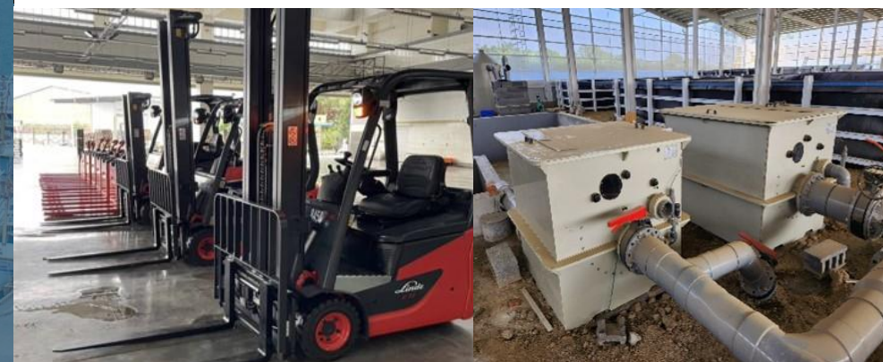
彰化埔心批發魚市場導入電動堆高機