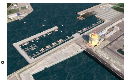
梧棲漁港小船泊區及浮動碼頭興建工程

已核定屏東縣下埔頭等 3 件養殖供排水計畫、澎湖縣強海上養殖整補基地設施計畫 7 件。