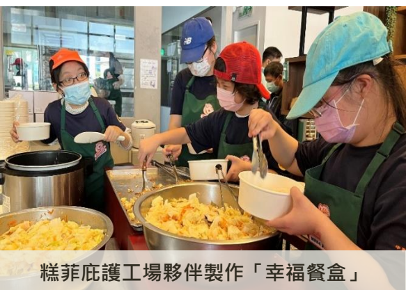
糕菲庇護工場夥伴製作「幸福餐盒」

已有 超過1,000家 全聯及家樂福等量販通路設置平價專區，迄今累計創造營業額逾 4,000萬元 。