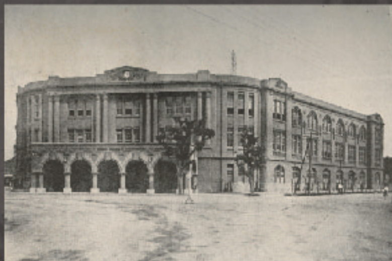
臺北郵局

現況 現今的臺北郵局仍然是運作中的郵政機構，建築物已被列為歷史建築保存，見證了臺灣歷史的變遷。