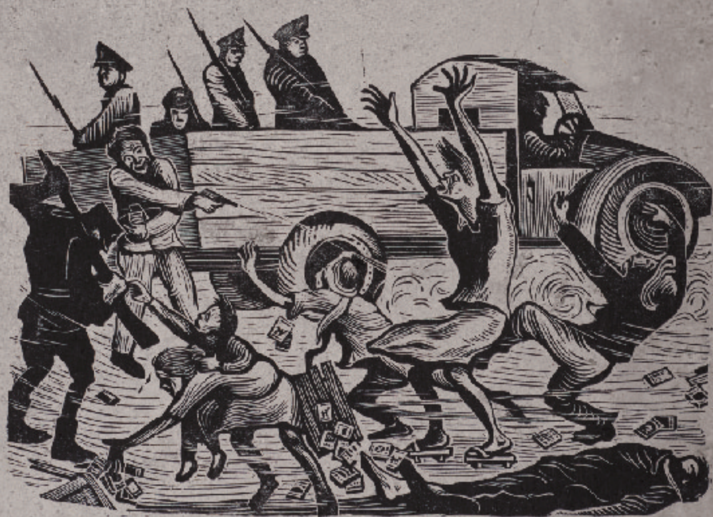
黃榮燦《恐怖的檢查》1947 木刻版畫

不義遺址不僅是歷史的見證，還是轉型正義中的要角，透過空間呈現了威權統治時期的壓迫體制面貌，這些遺址的存在提醒我們必須從歷史中學習，避免重蹈覆轍，也提醒人們正視歷史傷痕，促進反思，同時作為未來世代的重要教材。