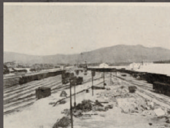
華山貨運站/國立臺灣大學圖書館藏

現況 現今華山貨運站劃歸由司法院管理，即將改建為「華山司法園區」。後續司法院也朝向最大原貌保存為原則，盡可能將月台遺構保留於原址。