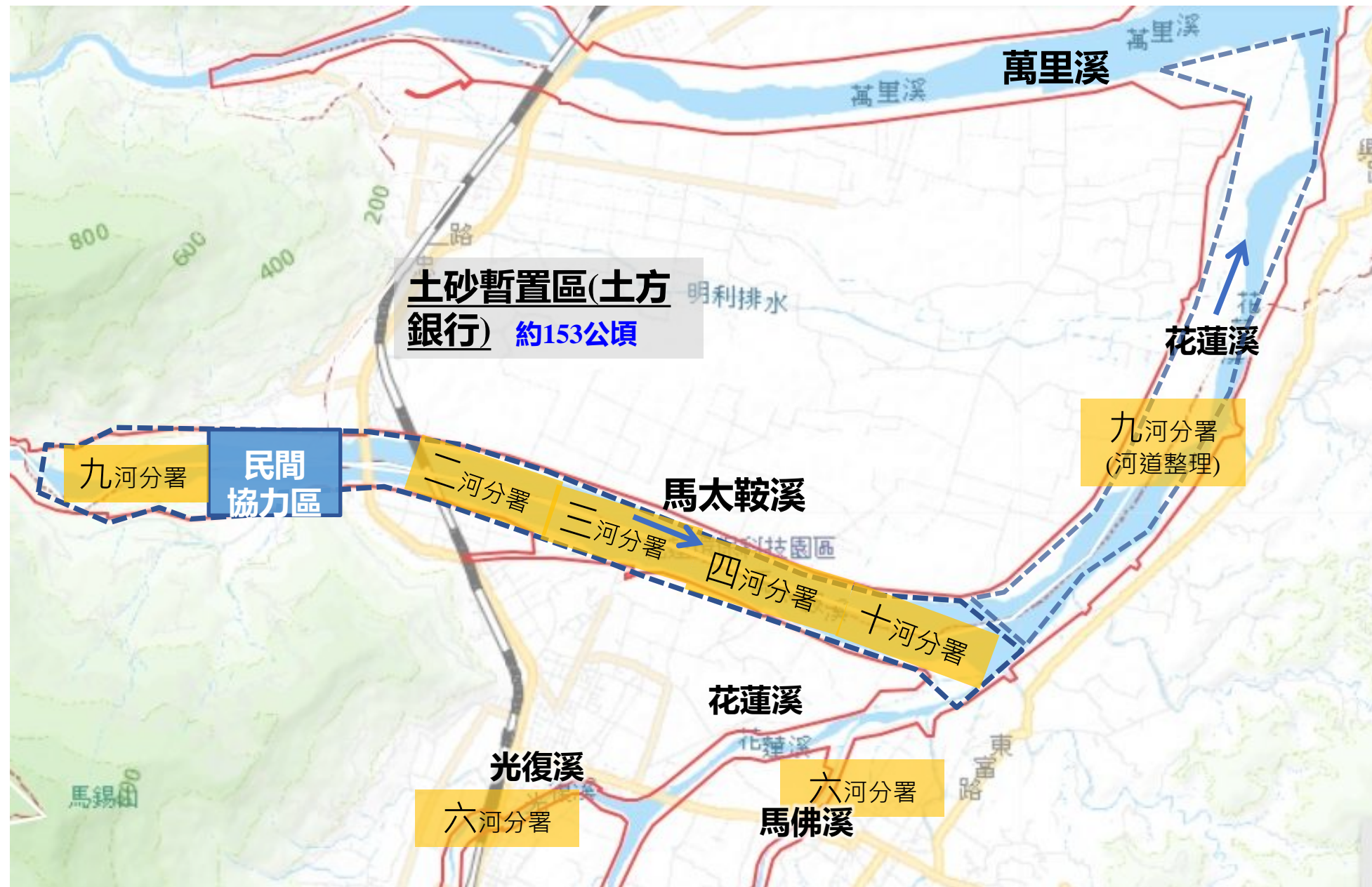
馬太鞍溪及花蓮溪緊急疏濬示意圖