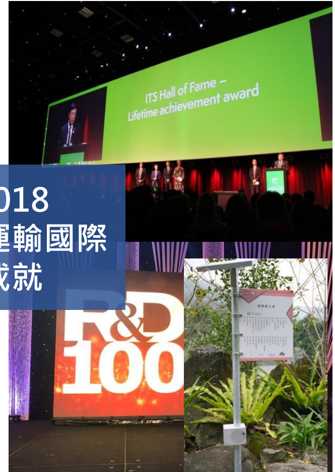
2018 智慧運輸國際 成就