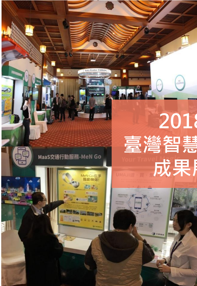
2018 臺灣智慧運輸 成果展