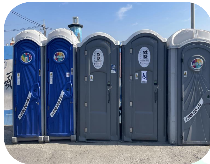
廣設無障礙廁所及沖洗設備