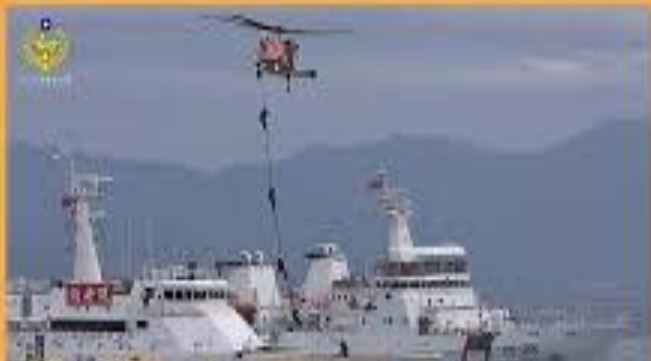
從平面偵蒐進入海空一體