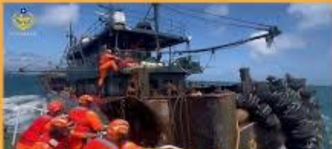
從肉身肉眼執法要進化為科技替代