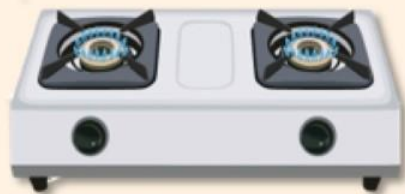
雙口爐以上 瓦斯爐