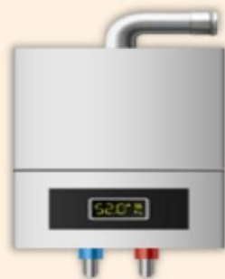
強制排氣式 瓦斯熱水器