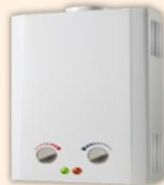
自然排氣式 瓦斯熱水器