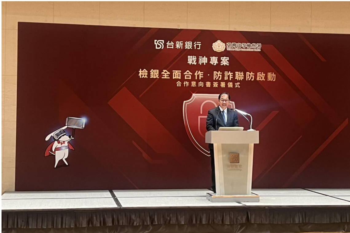
法務部鄭銘謙部長致詞勉勵