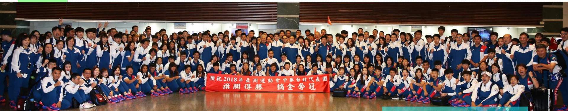
搭乘專機代表隊於機場合影